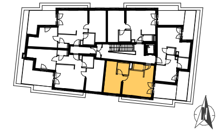
GRUNDRISS STIEGE 5:1.DACHGESCHOSS