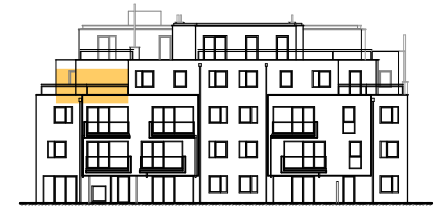
ANSICHT STIEGE 5

WOHNNUTZFLÄCHE 41.19 m 2 TERRASSE 18.31 m 2