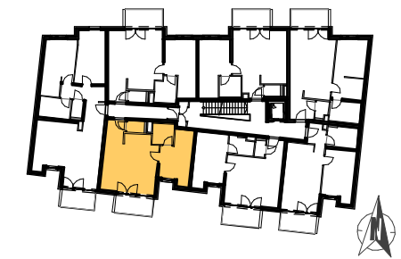
GRUNDRISS STIEGE 5: 2.OBERGESCHOSS