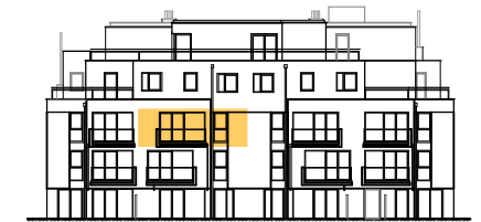
ANSICHT STIEGE 5