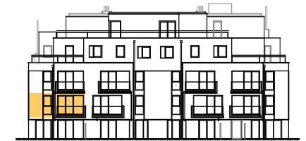
ANSICHT STIEGE 5

WOHNNUTZFLÄCHE 75.95 m 2 BALKON 4.94 m 2