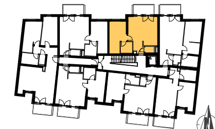
GRUNDRISS STIEGE 5: 1.OBERGESCHOSS