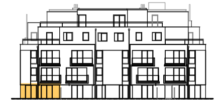
ANSICHT STIEGE 5