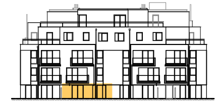
ANSICHT STIEGE 5