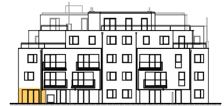
ANSICHT STIEGE 5