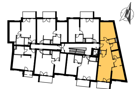
GRUNDRISS STIEGE 4: 2.OBERGESCHOSS