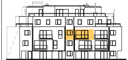
ANSICHT STIEGE 4

WOHNNUTZFLÄCHE 48.93 m 2 BALKON 5.50 m 2