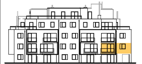
ANSICHT STIEGE 4

WOHNNUTZFLÄCHE 79.03 m 2 BALKON 5.50 m 2