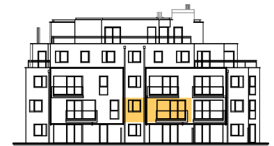
ANSICHT STIEGE 3

WOHNNUTZFLÄCHE 46.91 m 2 BALKON 5.50 m 2