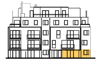
ANSICHT STIEGE 3