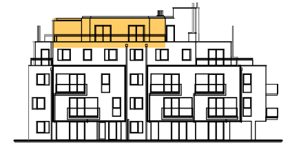
ANSICHT STIEGE 2

WOHNNUTZFLÄCHE 96.29 m 2 TERRASSE 78.63 m 2